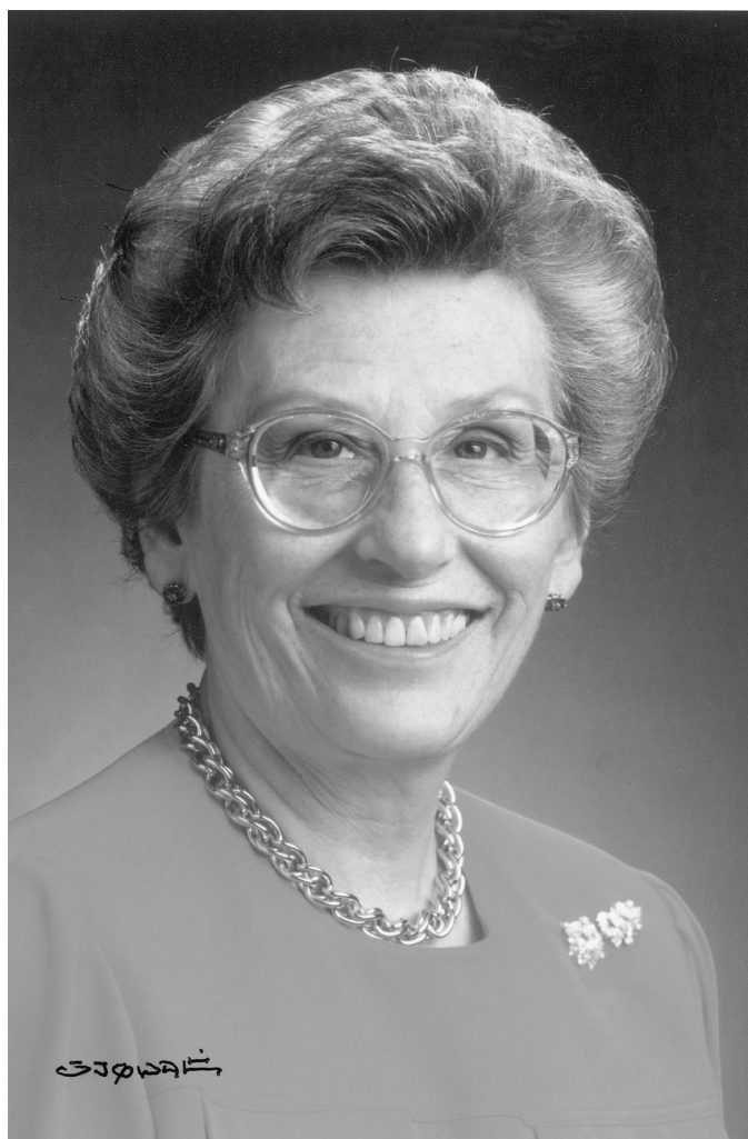
Prinsesse Astrid fru Ferner, vår høye beskytter, som vi er meget stolte av.