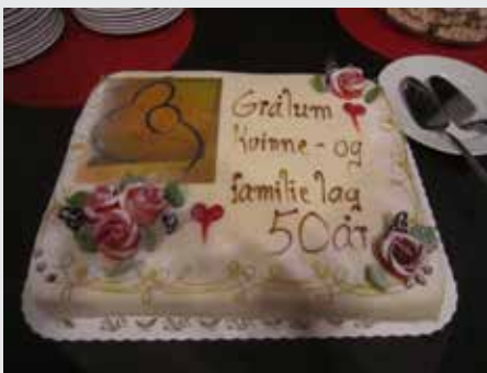
Deilig kake med logo.