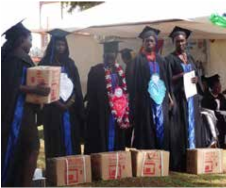
Graduantene i søm har fått symaskin i startpakke.