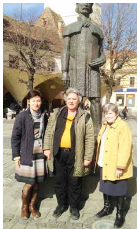
Fra reise til Romania.