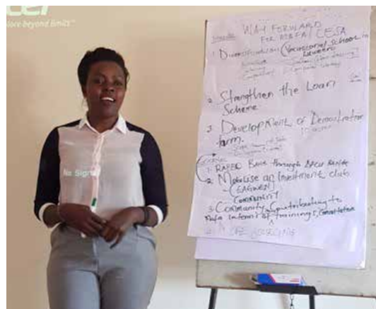
Gode ideer kommer frem på EAGWEN workshop.