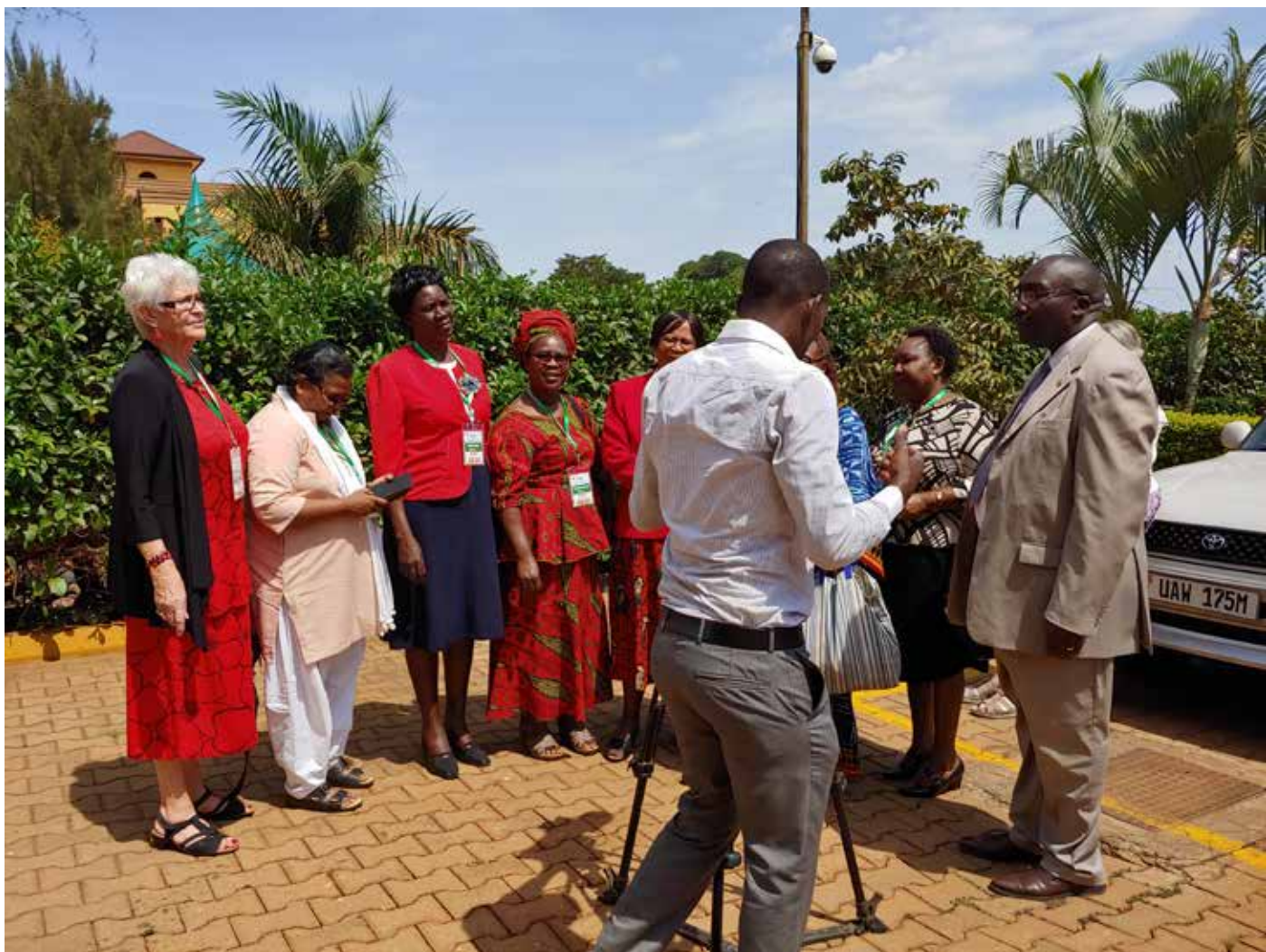
Foredragsholdere og TV-teamet. Nederst: Gode ideer kommer frem på EAGWEN workshop. Way forward.