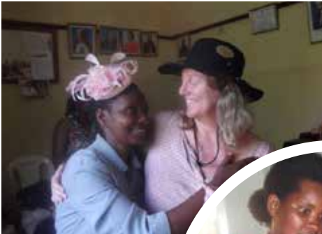
Farvel til tross - smilet og takknemligheten var stor.