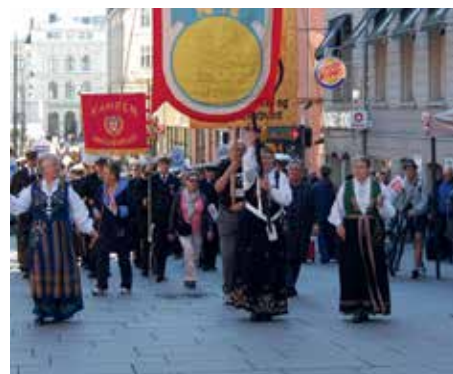
Jubileumstoget gjennom Oslos gater i 2015.