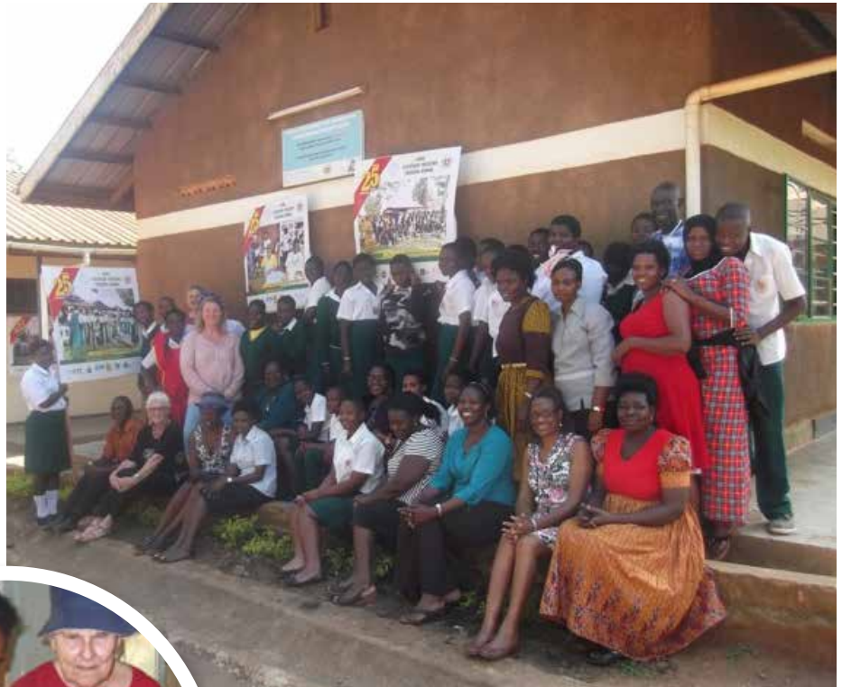
COWA-gjengen, lærere og elever.

En gruppe produserte rentbrennende fyring til ovner. En annen gruppe sydde vaskbare bind til jenter og kvinner. Det var en lang biltur opp i fjellene der tre grupper var samlet for å være vertskap for oss. Grusveien bar preg av at elver var blitt dannet i regnvær og laget dype spor i veien. Avstandene er store og det at vi ikke